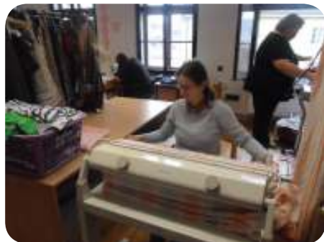
Šicí dílna v Domě charity