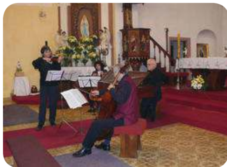
Oslava 20 let charity Vlašim