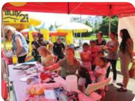
Den s Policií - aktivity nízkoprahového zařízení

Udržení dosavadních služeb a rozšíření provozu o další objekt, který budeme v roce 2015 přebírat. V objektu budou poskytovány služby azylový dům pro rodiny s dětmi a dům na půl cesty.