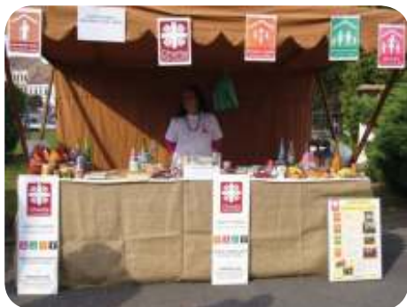
Účast na farmářských trzích

Farní charita Roudnice n. L. pracuje s rodinami s dětmi, které mají problém s bydlením a přechodně ho nalézají v našem azylovém domě. V současnosti především matky - samoživitelky s malými dětmi mají velký problém najít vhodné bydlení a následně ho ze svého nízkého příjmu dlouhodobě udržet. Točí se neustále v začarovaném kruhu azylových domů a jejich situace je často neřešitelná. Do budoucna bychom chtěli těmto rodinám nabídnout řešení na přechodnou dobu (startovací byty), které by jim pomohlo k návratu do běžného života.