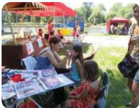
Dny Kralup - prezentace činnosti neziskových organizací