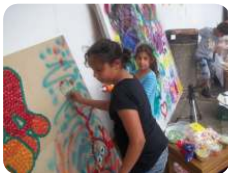
Nízkoprahové zařízení pro děti a mládež