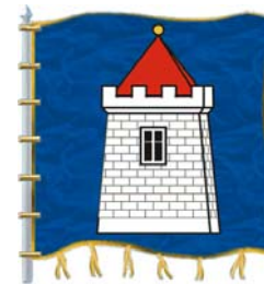
Kamýk nad Vltavou